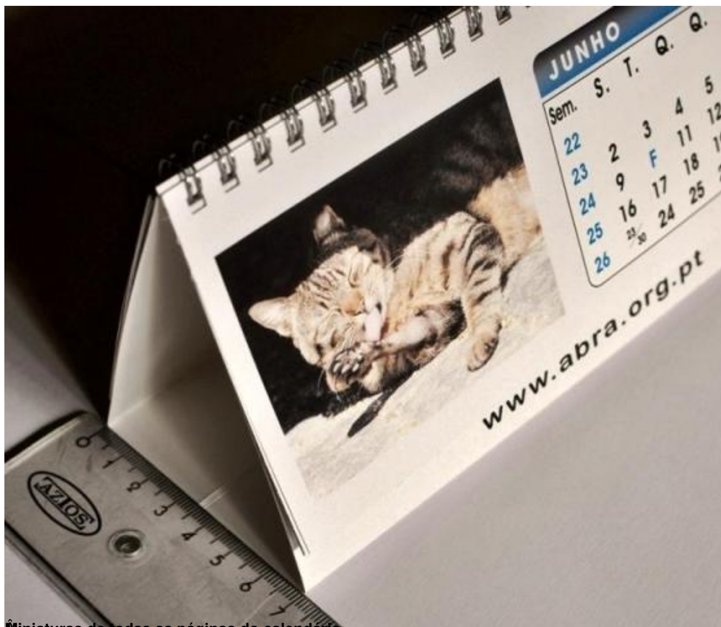
Miniaturas de todas as páginas do calendário